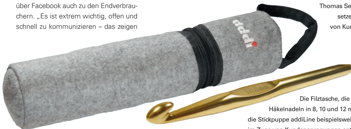
Die Filztasche, die goldenen Häkelnadeln in 8, 10 und 12 mm sowie die Strickpuppe addiLine beispielsweise wurden im Zuge von Kundenanregungen entwickelt.