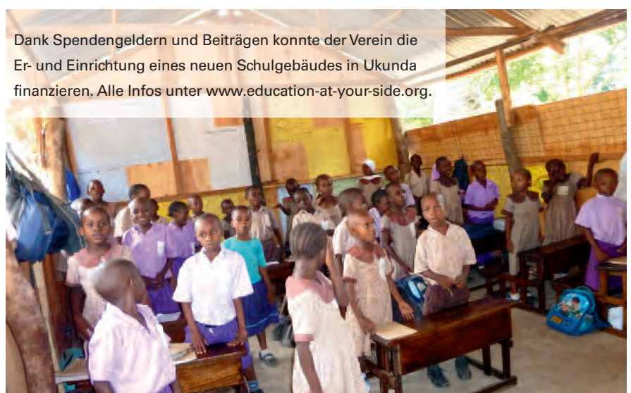
Dank Spendengeldern und Beiträgen konnte der Verein die Er- und Einrichtung eines neuen Schulgebäudes in Ukunda finanzieren. Alle Infos unter www.education-at-your-side.org .

Vom Brother-Firmenteam in Deutschland und Österreich wurde das Projekt „Education at your side“ ins Leben gerufen. Bei Recherchen waren Mitarbeiter auf eine Schule im kenianischen Ukunda gestoßen: „Wir waren bezaubert von den Bildern der Kinder, aber auch erschüttert vom schier unvorstellbaren Elend.“ Die Familien können sich kaum ernähren, entsprechend wenige Kinder erhalten überhaupt die Chance auf Bildung. Das Kollegium wollte es nicht beim Mitgefühl belassen – schnell war die Idee des Vereins geboren, der sich langfristig um das Wohl der Schule kümmern und Hilfe zur Selbsthilfe leisten soll. Inzwischen wurde seit August 2012 ein neues, einfaches Schulgebäude errichtet, und es wurden Schulbänke angeschafft. Anfang Januar konnten die